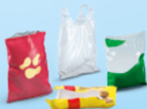
Sacs et sachets